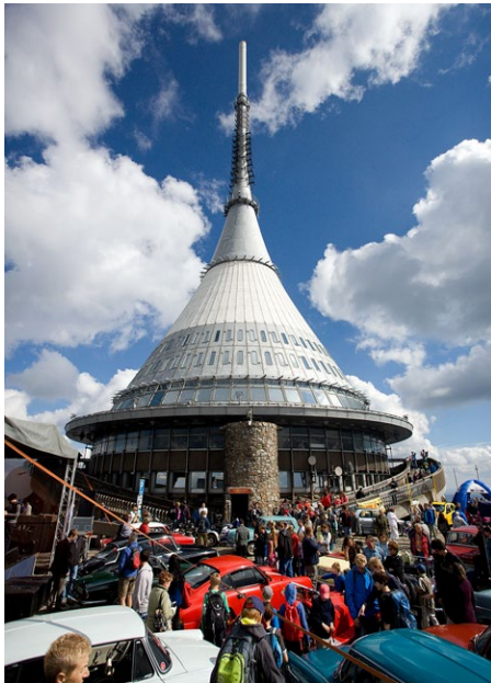
Letošní Oslavy Ještědu se ponosou ve filmovém duchu.

Dny evropského dědictví (European Heritage Days) každý rok v září umožňují veřejnosti